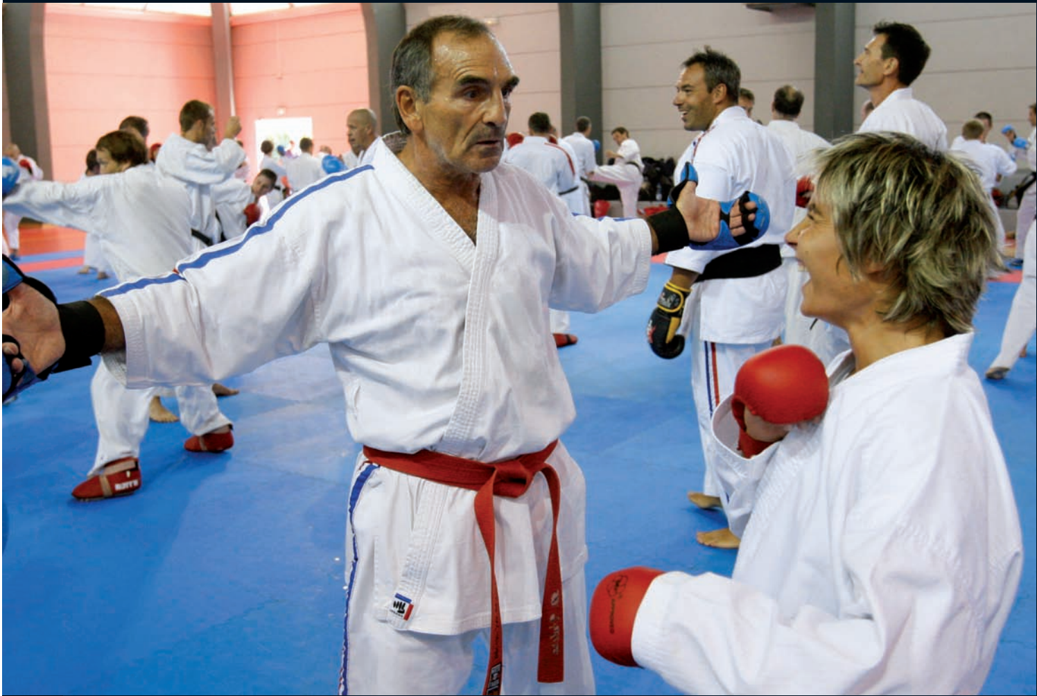
Une stagiaire de prestige avec Dominique Valéra : Jessica Buil, championne du monde kata.