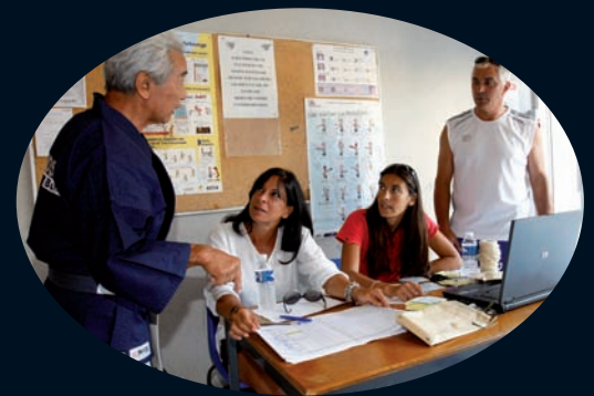
Le staff d'accueil.