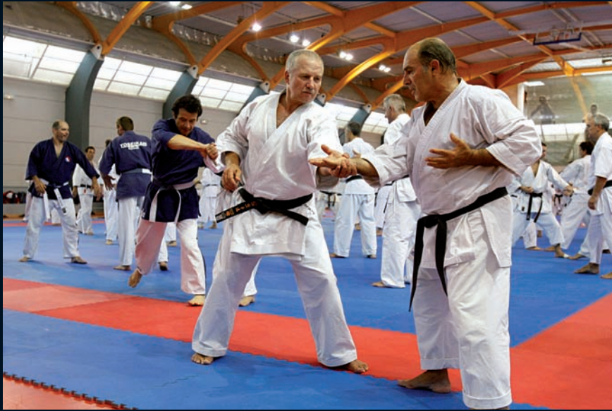
Entraînement intensif pour les stagiaires venus de tous horizons.