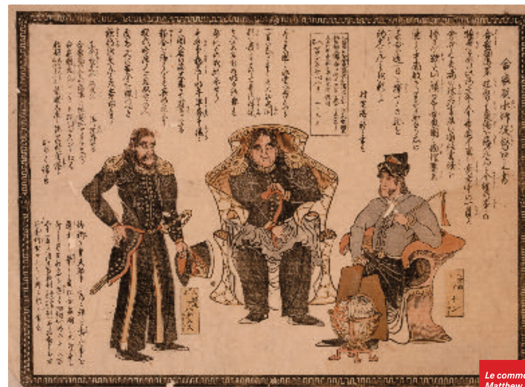
Le commodore Matthew C. Perry et sa flotte (ci-dessous).

L'arrivée des Américains l'avait fait réfléchir quant à la façon de réagir face à la demande d'ouverture des Occidentaux et, notamment, à l'importance de la marine, à la fois pour le commerce et pour la guerre. En 1861, il rejoint le Tosa Kinnô-tô, groupe partisan de l'empereur. Mais l'extrémisme des positions de ce parti et son manque de vision internationale font qu'il le quitte et il retourne, en 1862, à Edo où il rencontre Katsu Kaishû (1823-1899). Cet homme étonnant, qui occupera les plus hautes fonctions tant auprès du shôgunat que du gouvernement Meiji, sabreur émérite de surcroît, est alors occupé à la construction d'un centre de formation aux vaisseaux de guerre à Kôbe et Sakamoto Ryôma va devenir un de ses disciples. En 1864, suite à des heurts ayant opposé l'armée du shôgun et des membres du fief de Chôshû dont