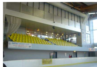
Tribunes et Bar Restaurant