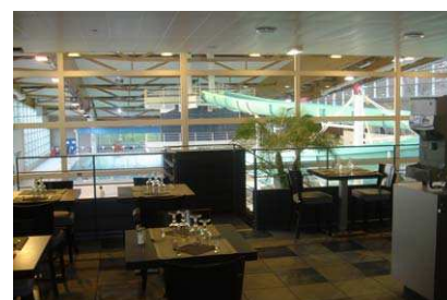
Restaurant et Piscine