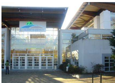
Entrée du Complexe

Sites internet : www.larchipel.fr - www.restaurant-ilot-archipel.com