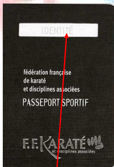
Première page du passeport N°1