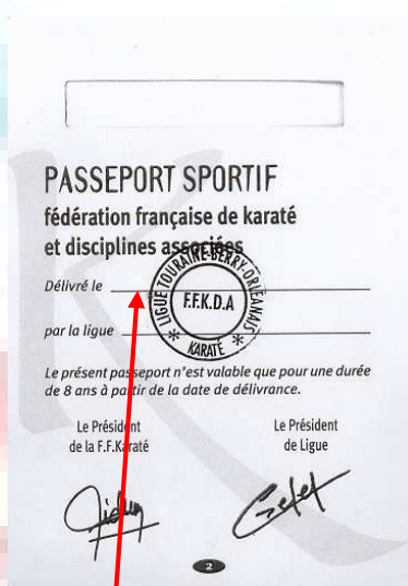
Verso de la première page N° 2

Stipuler la date de délivrance du passeport sportif