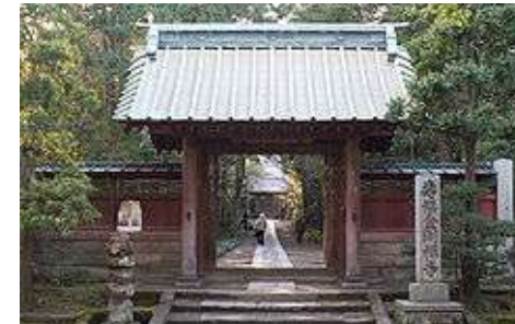
Temple au Japon Jufuku

Chambre de 2, 3,4 lits avec lavabo et douche et chambre à 6 lits avec sanitaires à l'étage.