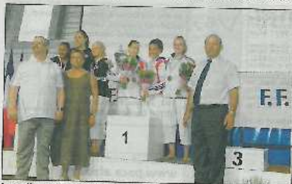
Le podium et la médaille d'or du trio français.

c'est de bon augure pour les championnats du monde où nous serons les gros outsiders de l'épreuve. Nous avons quatre mois de travail devant nous pour améliorer et peaufiner les petits détails qui feront certainement la