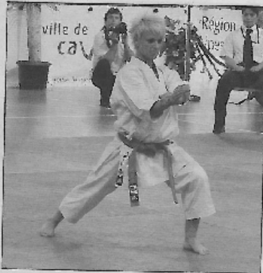
Vice-championne d'Europe au mois de mai dernier, la Française Sandy Scordo a remporté la médaille d'or dans l'épreuve de kata individuel.

C'était annoncé, l'Open International Féminin de karaté, organisé conjointement par la Ligue Côte d'Azur et la Fédération Française de Karaté à Cavalaire, avait, avec l'épreuve individuelle de kumité de samedi, un parfum de championnats du monde. Les six finales disputées étaient d'un niveau exceptionnel grâce à la présence des nations fortes de la discipline comme la Turquie, l'Angleterre, la Chine ou la France. Le spectacle a été de toute beauté et le suspense était également au rendez-vous puisque cinq de ces combats se sont joués après prolongations, seule la Turque Halisa Seyda en catégorie Open ayant pu faire la différence dans le temps réglementaire.