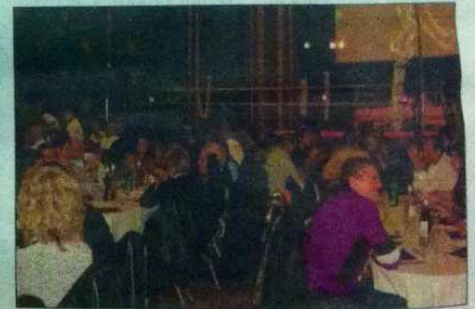
Un public toujours prêt pour lutter...

grands champions a ravi les amateurs de ce sport extrême.