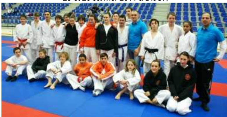
L'équipe UNSS de la Ligue Côte d'Azur lors du déplacement à Chevigny St Sauveur