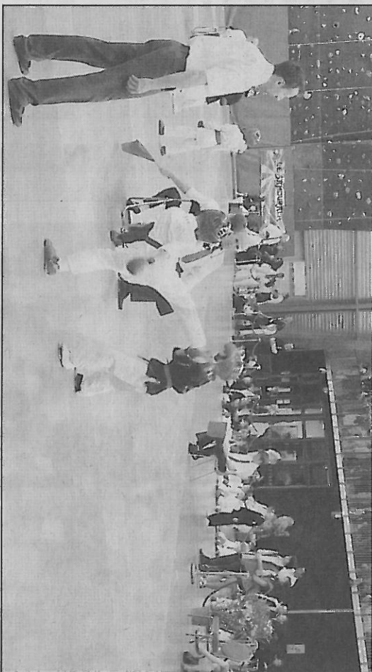
P. O. Les ligues de Côte d'Azur et des Flandres Artois ont pratiquement tout rafflé ! (Photos P. O.)

Il faut préciser que la délégation nordiste s'était déplacée avec deux bus et que leurs combattants étaient de vrais spécialistes du kempo... ceci explique cela.