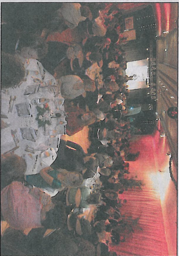
Le plateau proposé pour la deuxième édition de « Parfum de victoire » s'annonce très copieux et de qualité.

Du côté des athlètes de haut niveau, les têtes d'affiche sont incontestablement les nageurs Yannick Agnel et Camille Muffat mais aussi les volleyeuses de Cannes comme Victoria Ravva ou Karine Salinas, la triplette magique championne du monde de