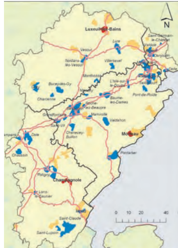
Figure 3 - Discrétisation des probabilités d'apparition

De cette manière, on peut identifier les communes qui auraient des tailles démographiques suffisantes pour abriter un nouveau club. Les noms des communes ayant un club sont en italiques (quand la place le permet !!) ; ceux des communes à probabilités moyennes et fortes en gras.